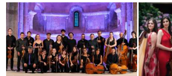
Camerata Clásica TMC